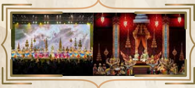
กิจกรรม “โขนพบโนรา มรดกวัฒนธรรมบนวิถีสืบสานและสร้างสรรค์” ภายใต้โครงการสังคีตสัญจร การแสดงโขน เรื่องรามเกียรติ์ ชุดพระจักรีปราบกสิญฑ และการแสดงโขน เรื่องรามเกียรติ์ ชุดรามมกุฎอยุธยา วันศุกร์ที่ ๔ และวันเสาร์ที่ ๕ สิงหาคม ๒๕๖๖ ณ ศูนย์ประชุมเฉลิมพระเกียรติ ๗ รอบ พระชนมพรรษา มหาวิทยาลัยสงขลานครินทร์ วิทยาเขตตรัง จังหวัดตรัง